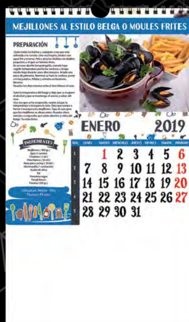
L-42 Recetas pescado