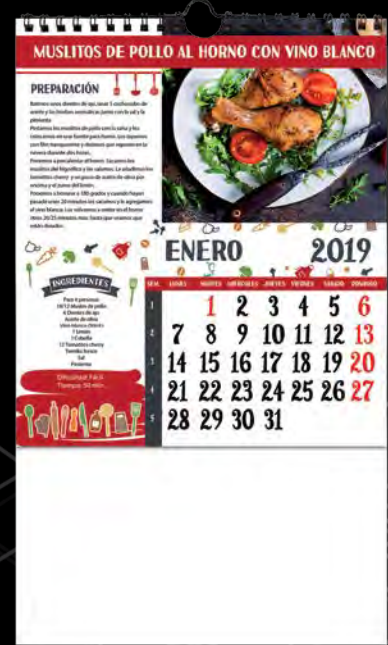
L-41 Recetas carne