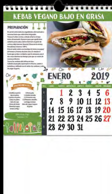
L-40 Recetas verdura